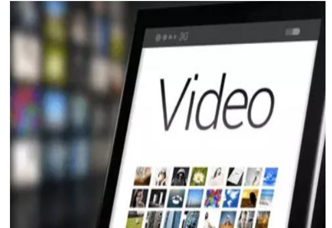
Aplicativos e filtros de edição