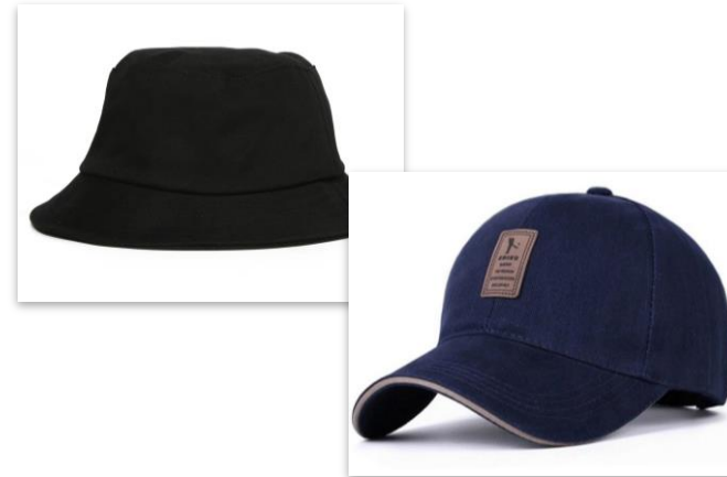
Chapéu, boné e similares